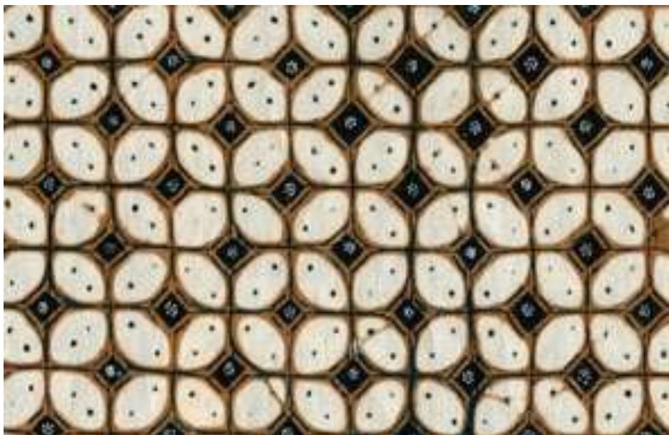
Gambar 2. Motif Kawung