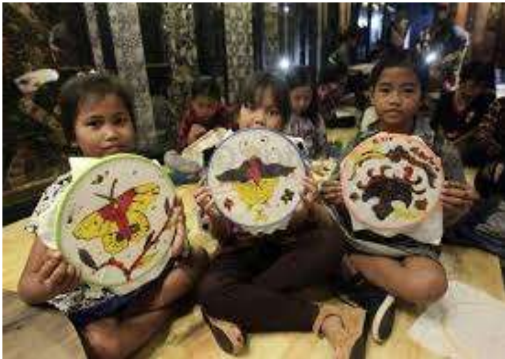
Gambar 5. Anak-anak Membatik Untuk Orang Tersayang

Proses membatik yang membutuhkan waktu yang panjang, anak akan lebih menghargai prestasi atau karya orang lain dan juga dirinya sendiri.