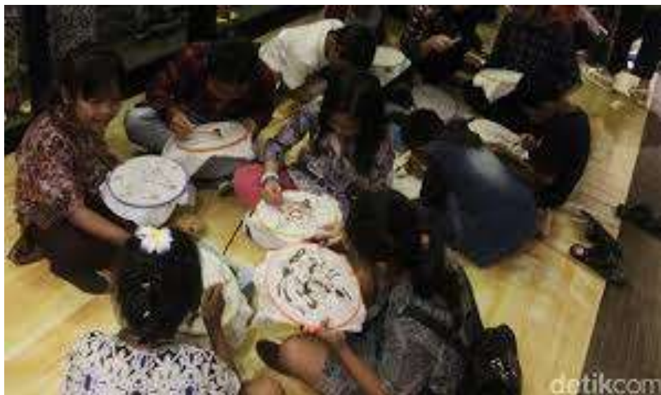
Gambar 3. Anak-anak belajar seni batik

Dalam seni batik secara tidak langsung mengajarkan nilai-nilai karakter yang baik dan nilai-nilai karakter yang salah. Gambar yang dituangkan dalam kain seperti tokoh pewayangan akan memberi inspirasi bagi anak. Dalam tokoh pewayangan terdapat nilai-nilai filosofi tentang kehidupan manusia. Ia banyak menampilkan dinamika kehidupan manusia baik sebagai individu maupun warga masyarakat luas. Tokoh pewayangan memuat nilai-nilai kemanusiaan. Watak pada tokoh wayang terdapat pula watak dalam kehidupan manusia yang sesungguhnya. Nilai-nilai yang baik, buruk, kesetiaan, kepatuhan, nasionalisme dan lain-lain. Demikian juga apabila yang di gambar tersebut alam, hewan maupun tumbuhan akan mengajarkan hubungan manusia dengan pencipta, manusia dengan manusia maupun manusia dengan lingkungan alam sehingga mampu menciptakan harmoni hubungan tersebut.