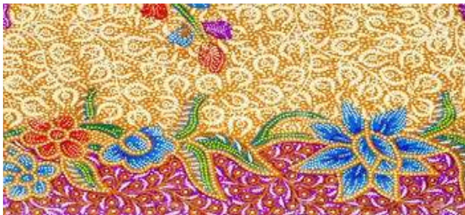
Gambar 4. Batik Sekar Jagad

Pencipta. Parang barong mengandung sesuatu yang besar tercermin pada besarnya ukuran motif tersebut pada kain. Parang barong hanya dikenakan oleh seorang raja. Mempunyai makna agar seorang raja selalu hati-hati dan dapat mengendalikan diri. Motif kawung mempunyai arti kebijaksanaan hidup. Sekar jagad melambangkan ungkapan cinta atau perdamaian. Motif sekar jagad memberi makna kecantikan dan keindahan yang melambangkan keragaman diseluruh dunia.