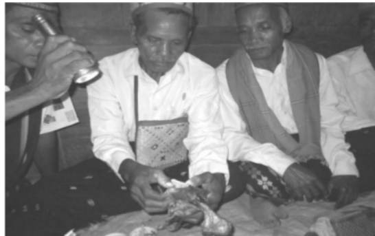
Gambar 1. Pemeriksaan hati ayam ( ngilo ura manu ) untuk mengetahui musim tanam akan mendapatkan hasil yang melimpah jika hati ayam tersebut sehat oleh pemimpin ritual (Pau Manu) dalam konteks ritual MbasaWini

6 Gagi nua dibantu oleh kaju ata , gagi sa'o , dan ata dangha pau manu . Relasi yang dijalankan dalam struktur kekuasaan ini sangat fungsional dengan pembagian tugas yang jelas sesuai tatanan adat yang berlaku. Gagi nua sebagai pemimpin tertinggi mengemban tugas mengatur segala aspek kehidupan dalam kelompok masyarakat. Dalam melaksanakan tugasnya gagi nua dibantu oleh kaju ata sebagai pelaksana teknis yang memegang peran sebagai pembagi tanah pembukaan lahan baru ( lodo ). Dalam ritual, gagi nua tidak memiliki peran langsung, namun wewenang ada pada gagi sa'o (pemimpin atau tetua dalam rumah adat) yang mengkoordinir upacara dalam satu suku. Seorang gagi sa'o menentukan seorang ata dangha pau manu untuk memimpin ritual termasuk mbasa wini berdasarkan otoritas rohaniah yang dimiliki.